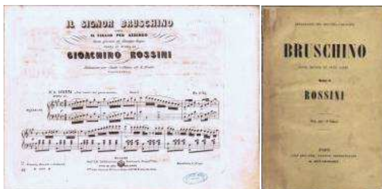
《ブルスキーノ氏》ガウデンツィオのカヴァティーナと、オッフエンバック改作版 《ブルスキーノ》の初版楽譜（ミラーノ、1854年／パリ、1857年。筆者所蔵）

20世紀最初の上演については定かでないが、1932年12月9日にニューヨークのメトロポリタン歌劇場で行われたアメリカ初演がそれに当たるかも知れない。1937年5月8日にはフィレンツェ五月音楽祭でも上演され、1960年7月14日にはイギリスのオーピントン（Orpington）でケント歌劇団による英国初演も行われた。その後は世界各地で上演されてきたが、リコルディ社の上演譜にはさまざまな問題があり、真の復活はロッシーニ財団の批判